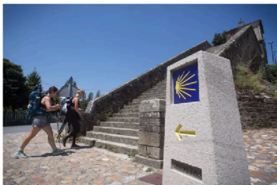
Dos personas realizan el Camino de Santiago, a 15 de junio de 2021, en Portomarin, Lugo, Galicia. (Espeño). MADRID, 21 Jun. (EUROPA PRESS)